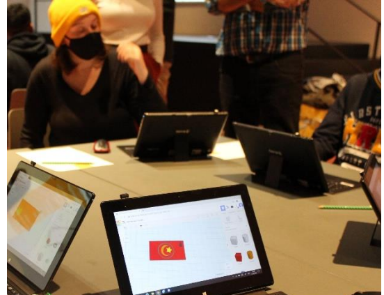
Lernende zeichnen ihre Schlüsselanhänger auf dem Laptop

Am 21. Oktober 2020 besuchte die Berufsschule Scala mit 17 Lernenden das Stadtmuseum Aarau. Dort konnten sie am Workshop «Cookie Caster» teilnehmen.