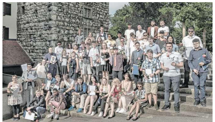
Viel Grund zum Feiern: erfolgreiche Absolventinnen und Absolventen der Berufsschule Scala.

Die Berufsschule Scala ist die erste interinstitutionelle Berufsschule für Menschen mit Beeinträchtigungen in der Schweiz und eine Abteilung der Stiftung Lebenshilfe, Reinach. (pd)