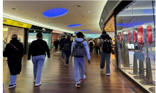
Spaziergang durchs Shoppi Tivoli

Das Shoppi Tivoli in Spreitenbach, eröffnet 1987, ist bis heute eines der grössten Einkaufszentren der Schweiz mit einer Verkaufsfläche von 70.000 Quadratmeter. Es bietet über 100 Geschäfte, darunter bekannte Marken wie H&M, Zara, Media-Markt und Coop. Zudem finden Besucher eine grosse Auswahl von Gastronomiebetrieben und Freizeitaktivitäten.